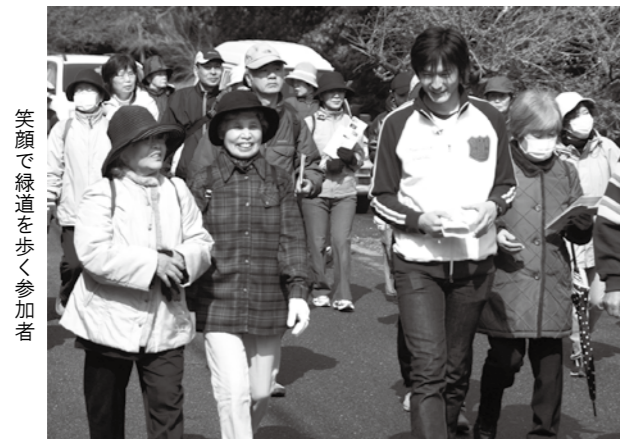
笑顔で緑道を歩く参加者

3月26日(土)、「ふみの里をめぐる宇美ウォーキング」が開催され、町内外から多くの方が参加されました。これは、糟屋中南部地域広域連携プロジェクト推進会議が企画している「かすやを学ぶ健康ウォーキングプロジェクト」のイベントとして行われ、参加者は宇美八幡宮を出発し、光正寺古墳、七夕池古墳、小林酒造などを巡りました。