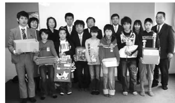
町内5つの小学校でも多くの義援金が集められ、宇美町社会福祉協議会を通じ、被災地へ送られました。