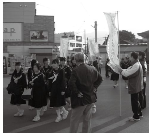
JR宇美駅前の街頭啓発の様子

青少年問題のもつ重要性を考え、広く町民の総意を集め、国、県及び町の施策を生かして、青少年の健全な育成及び非行防止を図ることを目的とし、町民の青少年育成に関係のある機関、団体をもって組織されている団体です。