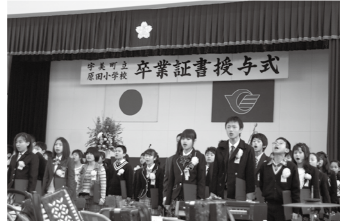
旧原田小学校の校歌を披露する卒業生

3月11日(金)に町内3つの中学校で、3月18日(金)に町内5つの小学校で卒業式が行われ、小学生392名、中学生329名が慣れ親しんだ学び舎を巣立ちました。