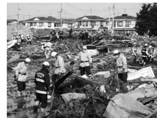
被災地で、被災者の救助・救出活動を行う粕屋南部消防署の隊員