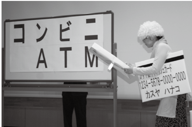
振り込め詐欺を題材にした寸劇の様子

3月12日(土)に「みるみるウォーク協力員研修会」が開催され、協力員の多くの方が出席されました。