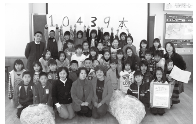
みんなで協力して、ばしを集めました。たくさんのわり

この取り組みは、「広報うみ8月号」で紹介した同団体による出前授業をきっかけに始まったもので、集められた10,439本分の割りばしが、紙に生まれ変わります。井野小学校では、今後も割りばしリサイクルに限らず、いろいろな面で「環境問題について考える」取り組みを行っていくということです。