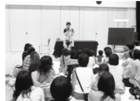
昨年のおはなし会の様子

おはなし会のあとは、短冊に願い事を書き、笹に飾り付けをします。皆さんの参加お待ちしております!