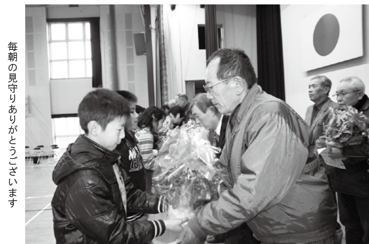
毎朝の見守りありがとうございます

12月21日(金)、宇美小学校の2学期終業式において、スクールガードボランティアの方々に子どもたちから感謝状とお花が贈られました。スクールガードボランティアは、通学路に立ち、毎朝登校する子どもたちを見守る活動をしています。6年生の児童が手作りした感謝状には、雨の日も風の日も毎朝早くから通学路に立ち、見守りをしているボランティアの方々への感謝の言葉が並び、5年生からも感謝の言葉とともにお花が手渡されました。