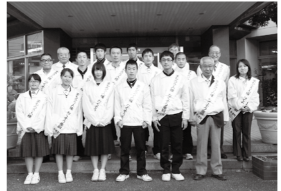
人権擁護委員と1日人権擁護委員として活動した中学生

福岡県人権擁護委員連合会及び福岡法務局では、12月4日～12月10日を「人権週間」と定め、人権意識の普及高揚を図るため様々な啓発行事を行っています。