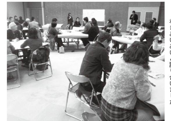
わきあいあい語り合いました

最終回である第4回目では、「宇美町をどんな町にしたいか?その実現のために自分は具体的に何をしたいか?」というテーマで活発に意見交換が行われ、参加者の皆さんからは、「元気をもらった。何かやりたくなった」「多種多様な意見があることを知った」「地元のことを考えるいい機会となった」等の感想がでていました。町では今後もこのような対話の場を継続的に設けたいと考えております。