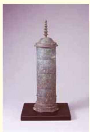
四王寺山出土の青銅製経筒

現在、小郡市の九州歴史資料館で、この経筒をはじめとして、四王寺山にゆかりのある資料を展示した企画展「聖地 四王寺山展」が開催されています。国の重要文化財をはじめ、普段は一般公開されていないものも展示されています。この機会に四王寺山の新たな魅力を発見できるかもしれません。