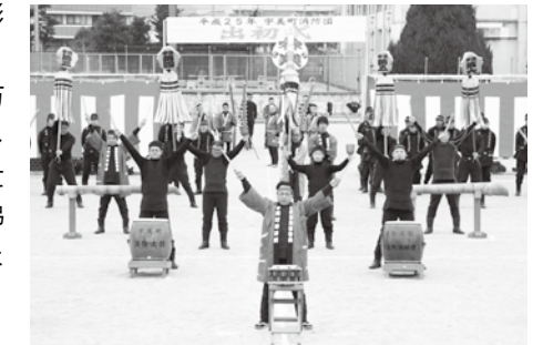
力強い演技と纏振り消防太鼓と纏振り

また、伝統技術披露として、消防太鼓、纏振り、宇美町消防団火消し節、梯子乗りが行われ、団員の勇壮な演技が披露されました。特に、梯子乗りでは次々と大技が決まるたびに、観客からはたくさんの拍手と大歓声があがっていました。