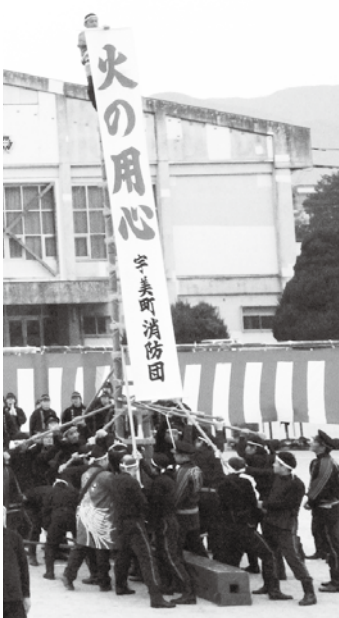
梯子乗りでは、火の用心の願いを込めた垂れ幕を披露しました

1月13日(日)に、宇美中学校グラウンドにおいて平成25年消防団出初式が行われ、消防団員をはじめ、多くの関係者が出席しました。規律正しく堂々とした入場行進から始まった式典では、表彰状及び感謝状の授与、伝統技術披露等が行われました。