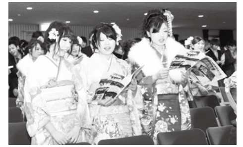
新成人のつどいの最後には各中学校の校歌を歌いました

実行委員会の提案で設置した義援金の金額は、2,622円となりました。義援金は中央共同募金会を通じて、被災地へ届けられます。御協力ありがとうございました。