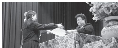
卒業証書を受け取る卒業生(宇美東中学校)

桜原小学校の卒業式では、校歌を高らかに歌い上げ、別れの言葉をはきはきと堂々と言う姿に6年間での成長が感じられる素晴らしい式となりました。