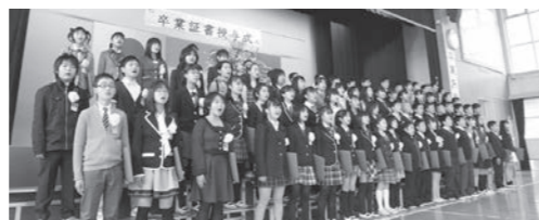
別れの言葉で歌を歌う卒業生(桜原小学校)