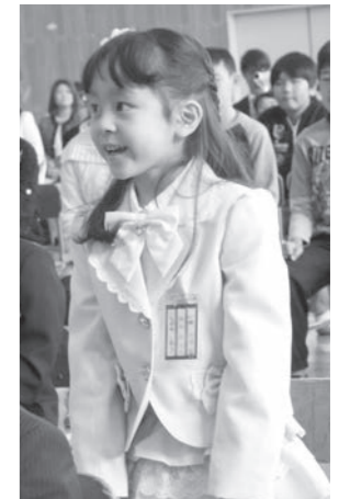
【井野小】元気に返事をしました