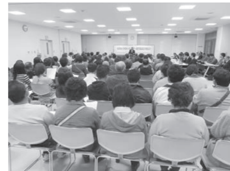
原田小学校区コミュニティ運営協議会発足会のようす

宇美町では、小学校区を範囲とする地域コミュニティづくりを推進しており、5つの小学校区のうち、モデルコミュニティ支援事業に応募のあった原田小学校区をモデルコミュニティとして選定し、地域コミュニティ活動を支援することが決定しました。原田小学校区コミュニティ運営協議会の取り組みについては、随時、町ホームページ及び広報うみ等でお知らせします。