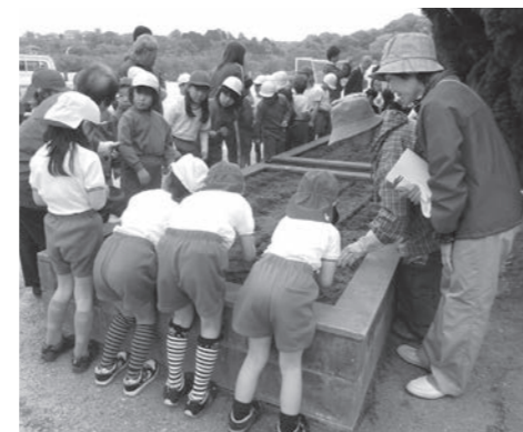
人権擁護委員さん、花ボランティアの皆さんに教わりながら、種の植え付けを行う児童達(原田小)

この運動は、主に小学生を対象とした啓発運動で、昭和57年度から実施されています。その内容は、配布された花の種子、球根などを、児童が協力しながら育成することを通して、協力、感謝することの大切さを学ぶとともに、情操を豊かにし、やさしい思いやりの心を体得させ、人権思想をはぐくむことを目的としています。