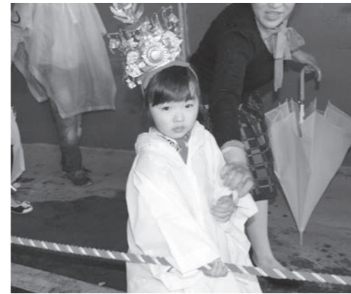
雨の中一生懸命に歩きました

この行列は、子どもたちの健やかな成長を願い、2年に一回開催されるもので、華やかな衣装を着た子どもたちは保護者の方に手を引かれながら、宇美八幡宮から井野山の頓宮までを歩きました。