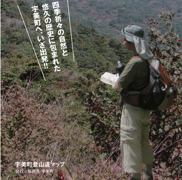
宇美町登山道マップ 発行：福岡県・宇美町