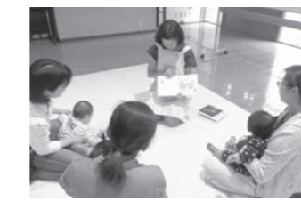
ブックスタートの様子