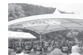
昭和の森山開きの様子