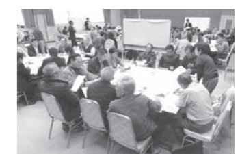
町民まちづくり検討会の様子

宇美町地域共働のためのコミュニティ 現状分析・支援事業…………… 329万5千円 (アンケートやワークショップの実施、モデルコミュニティ推進地区の支援等)