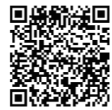
町ホームページはこちら