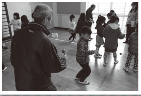
児童とのふれあい(宇美小校区)