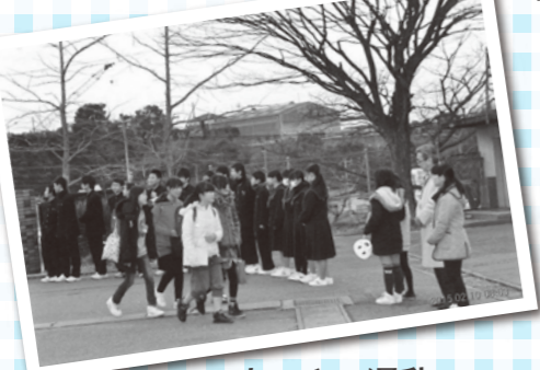
あいさつ運動(宇美東小校区)