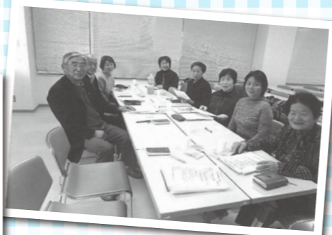
校区部会会議の様子(原田小校区)