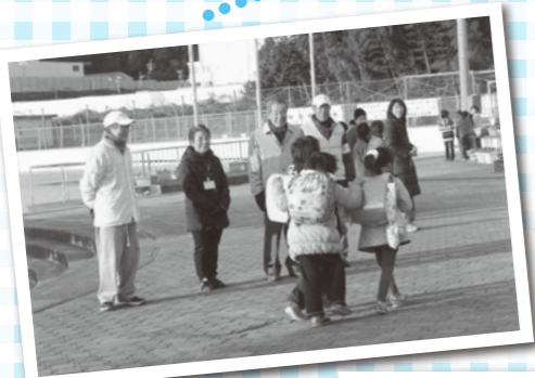
小学生登校見守り(井野小校区)