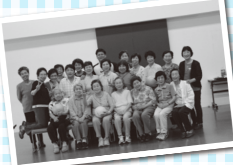
いきいきサロン参加(桜原小校区)